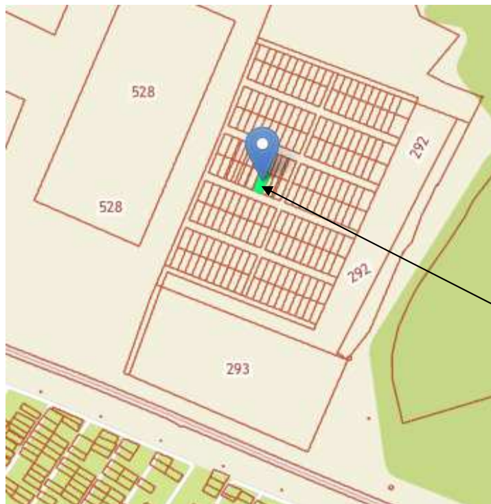
Рис.1. Схема расположения земельного участка в кадастровом квартале

Земельный участок с кадастровым номером 18:27:070002:526