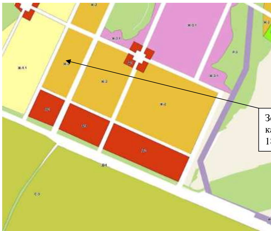
Рис.2. Выкопировка из ПЗЗ г.Воткинска.

Земельный участок с кадастровым номером 18:27:070002:526